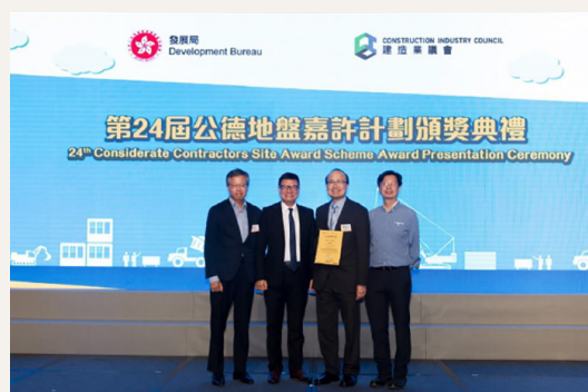
第24届公德地盘嘉许计划颁奖典礼