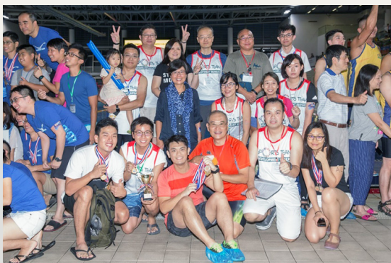
建築署泳隊出戰水運會