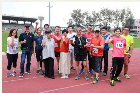
2018年4月18日，建築署在香港建築師學會運動會盡顯團隊合作精神