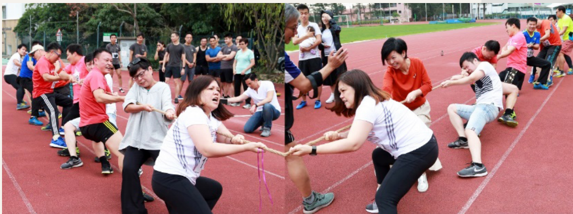
建築署賽隊在香港建築師學會運動會拔河競技