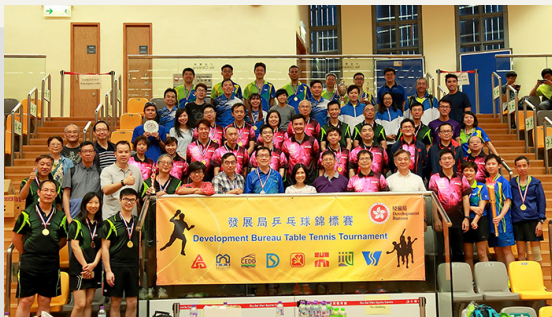
建築署乒乓球隊參加發展局乒乓球錦標賽

我們關顧員工的身心健康，為此除了致力培育和諧的工作文化外，也積極鼓勵員工參與各類康樂活動，以促進作息平衡及鞏固團隊合作精神和對部門的歸屬感。今年，我們的同事參加了由部門或外間舉辦的各項運動及康樂活動。年內的重點活動如下：