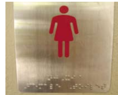
4.5m 附有點字的圖形標誌