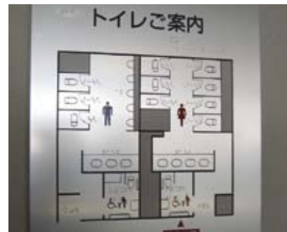
4.5k 指示通往衛生設施的觸覺指南