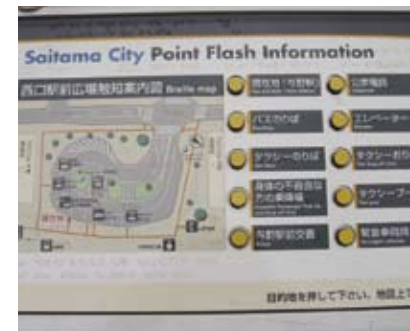
4.5c 多媒體互動指南提供文字、圖像、聲頻及點字資訊