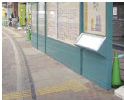
4.5a 觸覺引路帶通往多媒體標誌