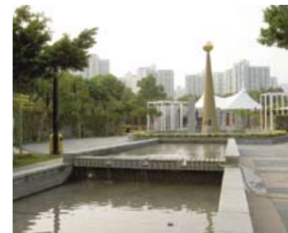
4.5i 休憩用地的雕塑可作為視覺標誌，有助導向及引路