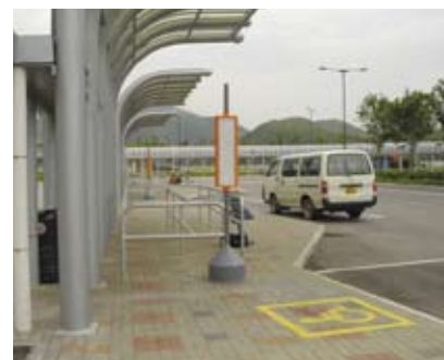
4.5p 顯示公共交通設施通達上落客點的標誌