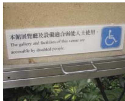
4.5e 指示通達設施的標誌