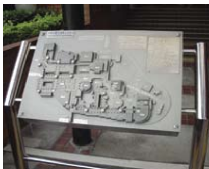
4.5g 立體觸覺指南讓不同能力的使用者掌握周圍環境的整體情況