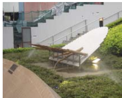
4.5h 具感官元素的雕塑有助導向及引路