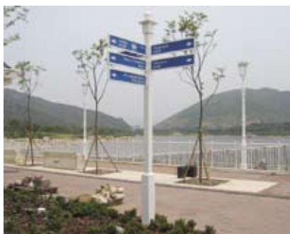
4.5d 方向指示牌的圖文資訊與背景顏色對比鮮明