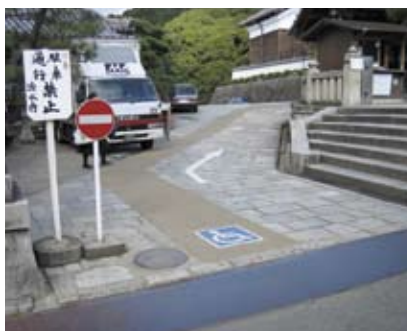
4.5r 以國際通達標誌顯示可供坐輪椅人士使用的特定通達路徑