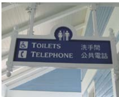
4.5n 顏色與周圍表面對比鮮明的劃一圖示標誌