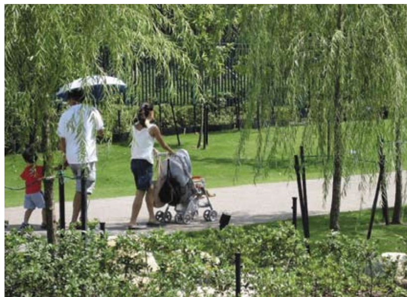
1.2b 便於使用和暢通無阻的休憩用地