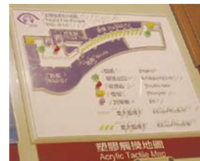
4.5q 为不同使用者而设的触觉走火路线图