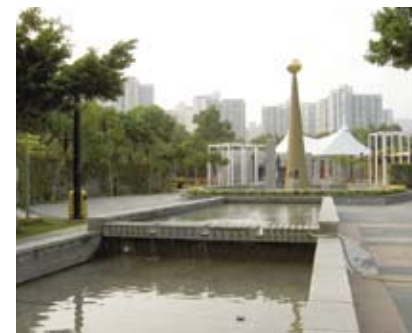
4.5i 休憩用地的雕塑可作为视觉标志，有助导向及引路