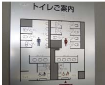
4.5k 指示通达卫生设施的触觉指南