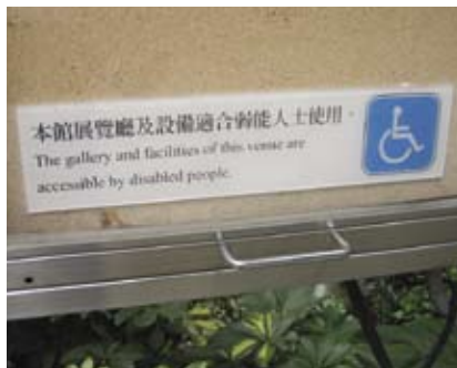
4.5e 指示通达设施的标志