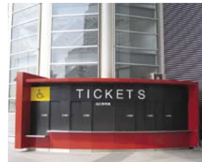
4.5f 大型标志以颜色对比鲜明的国际通达符号标示通达服务柜台