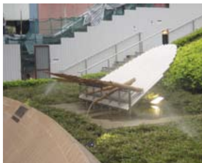
4.5h 具感官元素的雕塑有助导向及引路