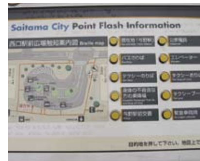
4.5c 多媒体互动指南提供文字、图像、声频及点字资讯