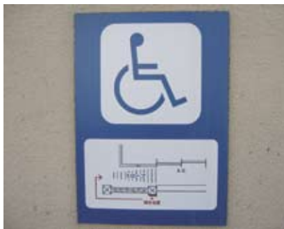
4.5j 显示通达建筑物入口位置的标志