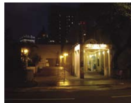
4.8q 利用灯光突显建筑物的入口及标志