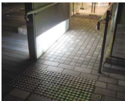
4.8d 斜道设置矮身侧灯