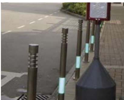
4.8n 路边防撞柱镶有反光带，容易辨识