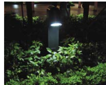
4.8c 花槽内加有外罩的矮灯向下照射