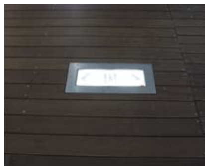
4.8e 出路方向指示灯牌与周围地板齐平