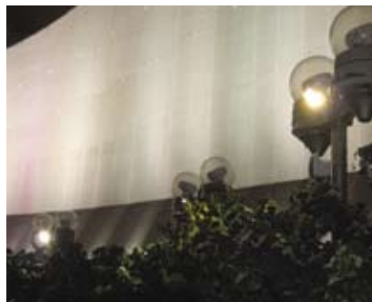
4.8k 花槽内的灯柱营造特别效果