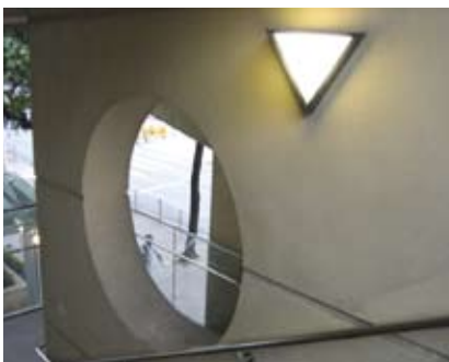
4.8r 在日照不足的暗角加装电灯，以便补充光线