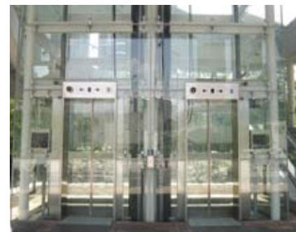
4.8t 透明的升降槽和升降机厢，日间让阳光透进，晚间灯光可以外溢，一举两得