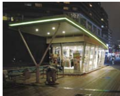
4.8b 檐篷边缘的灯光加上室内光线外溢，可尽量减低外墙的照明需要