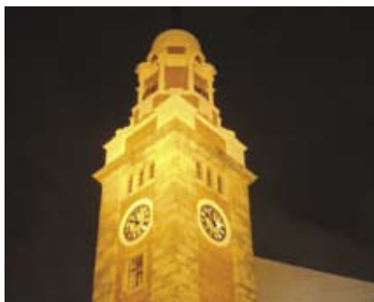
4.8g 灯光明亮的钟楼成为地标