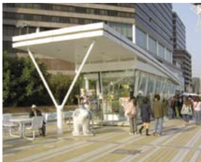
4.8a 阳光于日间透进凉亭