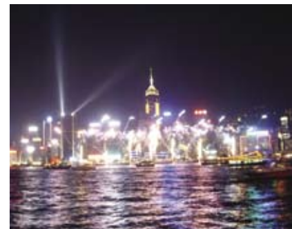
4.8m 灯光汇演照亮明净夜空，海滨没有灯柱等设施妨碍观赏