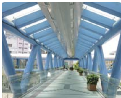
4.8s 行人天桥顶盖设有天窗，中间加装一排电灯