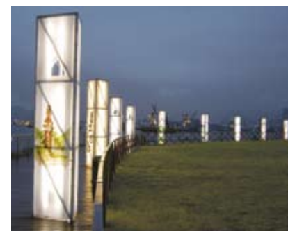
4.8f 柱形灯箱不但照亮行人径，本身亦有观赏价值