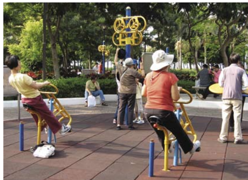
1.3b 切合不同需要的设施