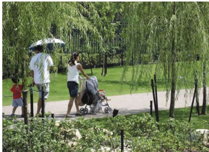
1.2b 便于使用和畅通无阻的休憩用地