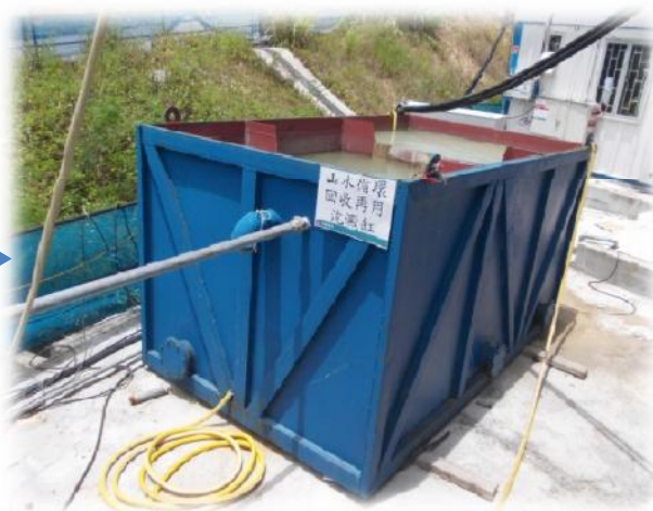
山水收集淨化處理