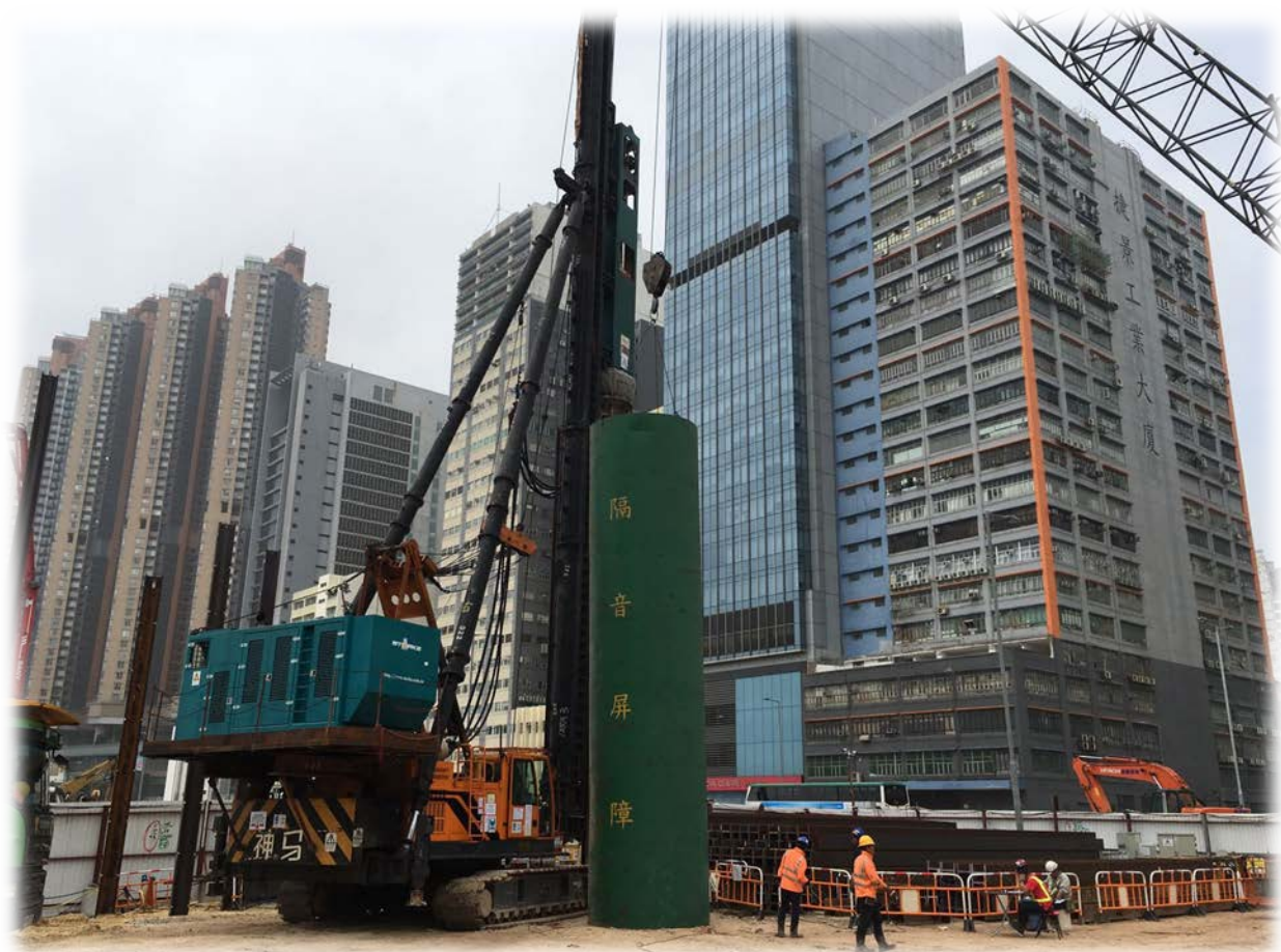
隔音罩用于打桩工序，可减少15 dB (A) (由经过认证的实验室测量)