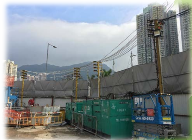
隔音布竖立于地盘边界