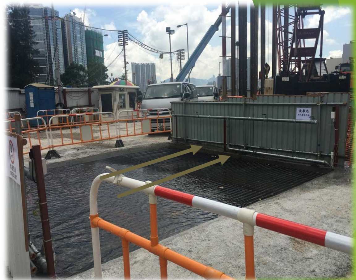
使用回收的废水进行车轮清洗