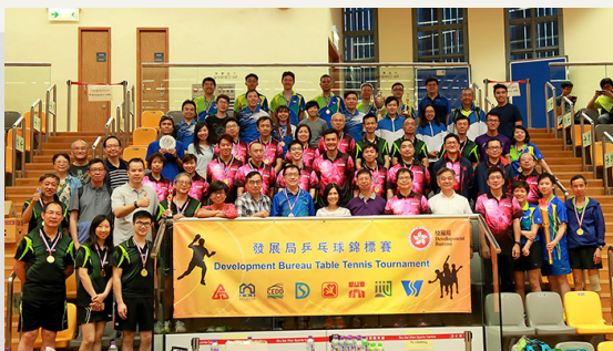
建筑署乒乓球队参加发展局乒乓球锦标赛

我们关顾员工的身心健康，为此除了致力培育和谐的工作文化外，也积极鼓励员工参与各类康乐活动，以促进作息平衡及巩固团队合作精神和对部门的归属感。今年，我们的同事参加了由部门或外间举办的各项运动及康乐活动。年内的重点活动如下：