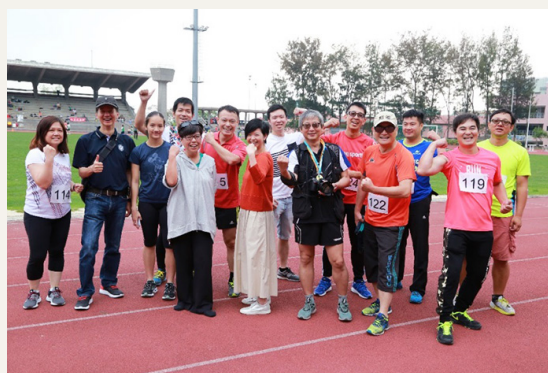
2018年4月18日，建筑署在香港建筑师学会运动会尽显团队合作精神