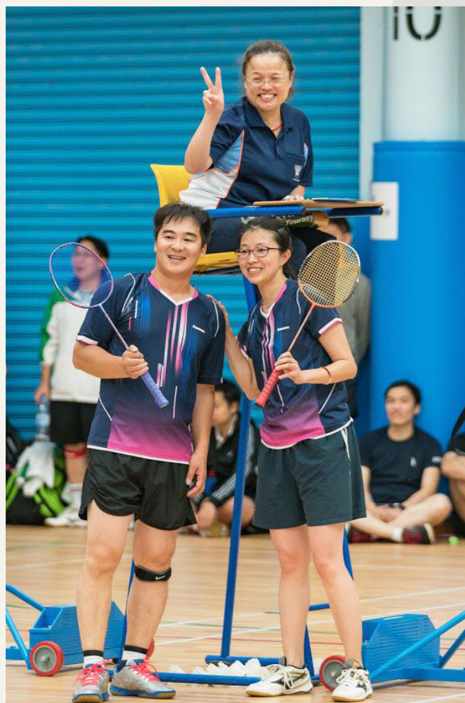
建筑署员工参加羽毛球赛