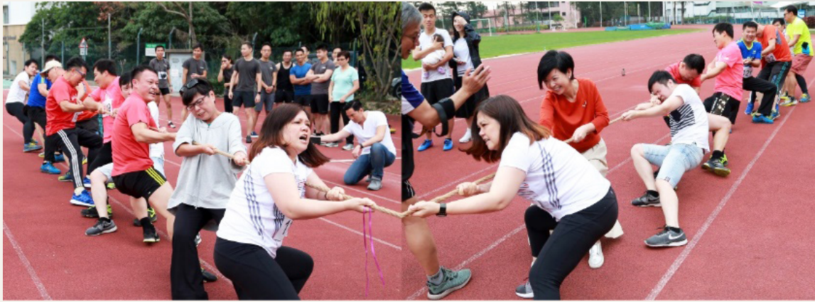
建筑署赛队在香港建筑师学会运动会拔河竞技