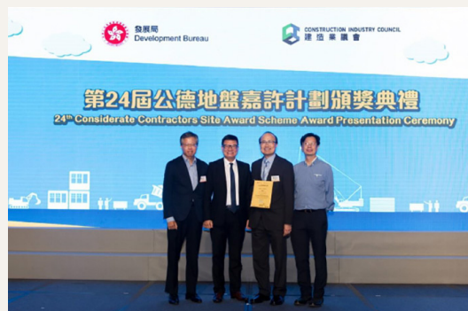
第24屆公德地盤嘉許計劃頒獎典禮