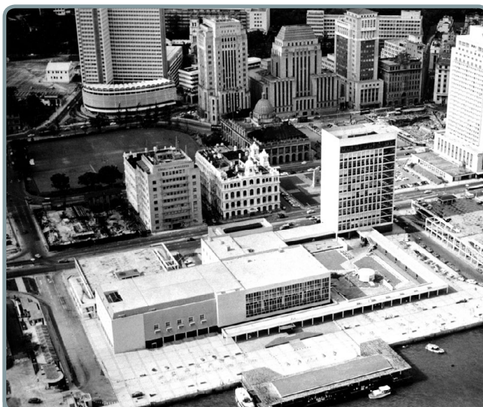
攝於1950年代的香港大會堂